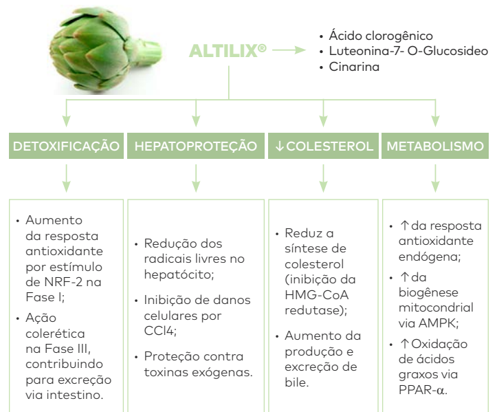
Resumo das ações e benefícios de Altlix® .